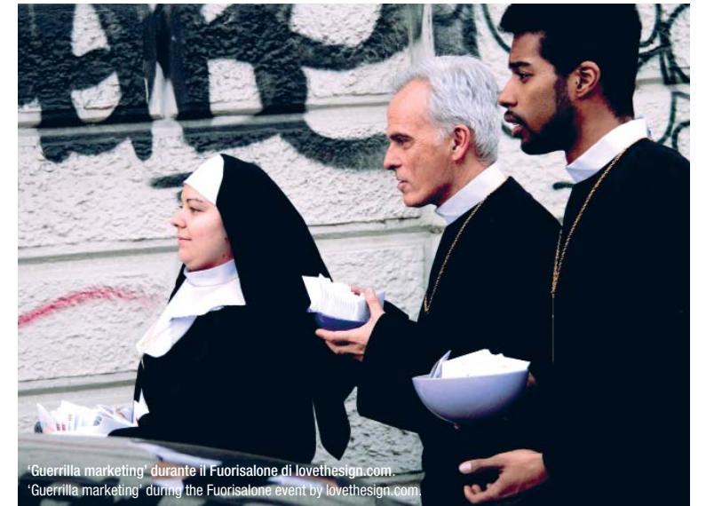
'Guerrilla marketing' durante il Fuorisalone di lovethesign.com. 'Guerrilla marketing' during the Fuorisalone event by lovethesign.com

The tool of the Internet lets hybrids be made between production, promotion, and sales, which until this last decade were autonomous and compartmentalized. Now there is no longer a difference between companies, showrooms, logistics and advertising pages. All of these can co-exist on a single site. After a first, all-Italian wave of digital hubs for bringing creativity supply and demand together, we are already seeing the signs of a second phase in which web culture seeks to integrate a demand that is general rather than just specific. End users are listened to in order to measure the approval of a product before it is produced on a large scale. This is the origin of the boom in e-shops with a significant talent scouting role and that offer discounted pieces for a limited time. Fab.com is the most popular in Europe, India and the U.S. Its successors in Italy – newly born and already in 'guerrilla marketing' – are lovethesign.com and lovli.it, both Milan-based.