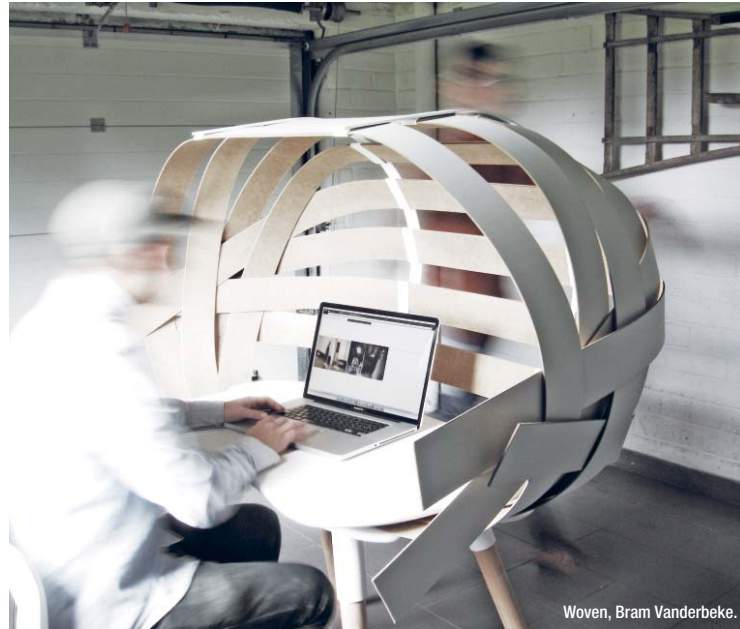
Woven, Bram Vanderbeke.