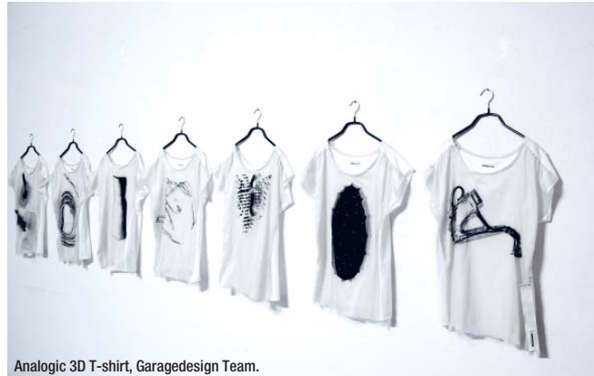
Analogic 3D T-shirt, Garagedesign Team.

Blanco, Electrolux e Garagedesign. After the forerunner designboom – the first online magazine founded in 1999, named one of the 100 most influential media, created to publish and discover the best designs through competitions, influence tastes and set trends – the history of similar Italian websites started a decade later. A production studio and web shop of original design objects, Garagedesign was founded in 2010, the precursor of platforms that support design production that is self-produced and on-demand, and, when a minimal threshold of requests is reached, on-line distribution. There is already a Garagedesign Prize, given to the best designs shown in the 'Open Design Italia' exhibition that will launch its own online factory in the fall. During the Fuorisalone 2013, www.garagedesign.it , in live streaming from Officina Scic, the first kitchen made online was introduced. Taak by Matteo Nativo was the winner of the Compact Kitchen Station competition organized by SCIC, Blanco, Electrolux, and Garagedesign.