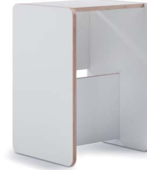
Sgabello multiuso Rolle di Mario Palmieri. Rolle multipurpose seat by Mario Palmieri.

concorsi, realizzati dalle piccole aziende manifatturiere partner del progetto. Formabilio.com is a newcomer, founded in early 2013. Cross-pollinating with the approaches of those who came before, Formabilio pushes ahead with the value of community, raising it to the level of jury and judge of what is put into production. In the '90s, market studies were the tool of choice for forming consensus. Now the web can be the tool that maps desires, expectations and habits of using products. At Fuorisalone 2013, the platform expands supply and, beyond participatory design projects, it follows the trend that has taken off in Italy of e-shops. It launches e-commerce in which the winning products can be bought from the first two competitions, made by manufacturers who are project partners.