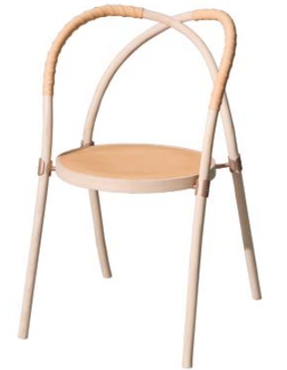
Bow Chair di Lisa Hilland prodotta da Gemla. Bow Chair by Lisa Hilland, made by Gemla.

magazines became a trend supporting design that continues to operate at high quality levels, particularly in northern and Scandinavian countries, with the Dutch and Danish taking the lead. The show 'Malmö by Proxy', with Form/Design Center, speaks about the importance of investment in innovation, research and creative businesses such as design and music for the manufacturing revival of a small city through the synergy of many players, institutions, SMEs, and designers. This is a system that Italy ought to imitate for the renewal and promotion of its diverse production districts.